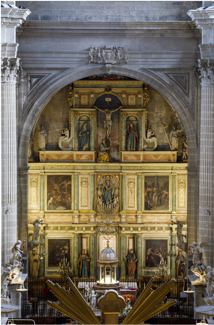
Fig. 4. Capilla mayor. Jaén, Catedral de la Asunción