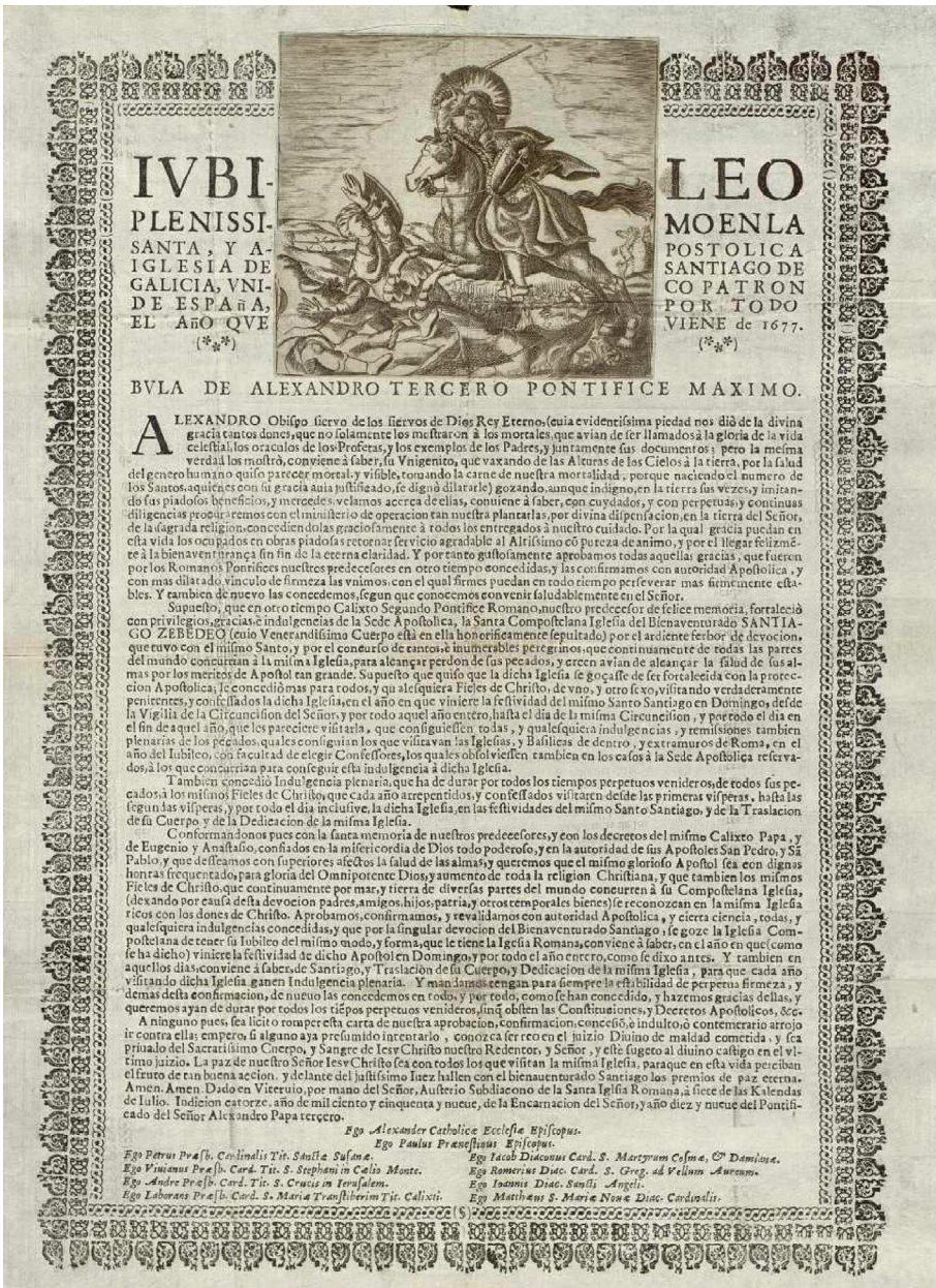
Fig. 1. Publicación oficial del Año Santo de 1677 remitido por el Cabildo de Santiago a las ciudades y villas con el texto de la bula alejandrina. En carta adjunta se recalca la apertura de “este thesorero espiritual con las mismas graçias y prerogativas que el de San Pedro de Roma” (1676). Archivo Histórico Municipal de Toledo, Sig. CTL_1139