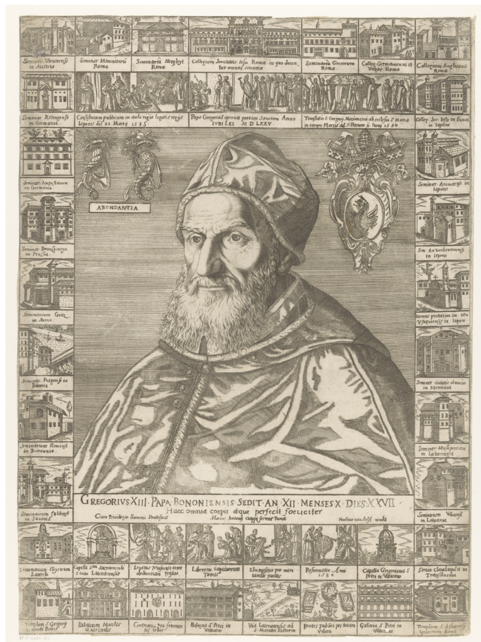
Figure 1. Engraving ca. 1582-1585 of Gregory XIII surrounded by events and buildings erected during his pontificate. Rijksmuseum Amsterdam. Inv. RP-P-2005-331

The inventory of the objects in the Apostolic Palace upon his death, which is published here, in part reflects his occupancy of the papacy, which were important years for both the papal court and the Catholic Church in which the pontiff sought to bring the world to Rome. At the same time the world, both Europe and beyond, also sought to reach Rome and obtain the attention and favour of the sovereign pontiff. The lengthy guardaroba pres-