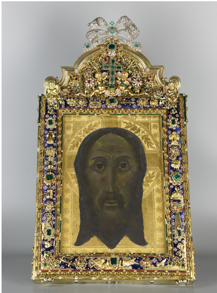
Fig. 1. Santo Rostro. Jaén, Catedral de la Asunción

devocional de la península ibérica. De hecho, la fuerte identidad que generó en la ciudad se podría equiparar con la existente en otros enclaves que custodiaban importantes reliquias como Santiago de Compostela, Oviedo y Daroca; la primera, con el cuerpo del apóstol; la segunda, con el Santo Sudario de Cristo y la tercera, con los Sagrados Corporales. 2 La reliquia de Jaén tuvo muy presente a la romana y se consideró a su mismo nivel. En el presente trabajo analizaremos los puntos en común entre una y otra, así como los intereses que condujeron a esta equiparación.