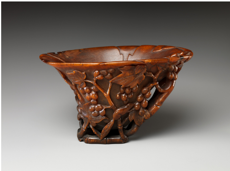
Figure 6. Cup with grapes. Metropolitan Museum of Art, New York. Object number 08.212.1