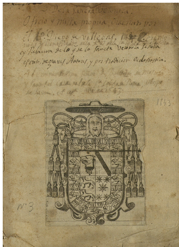
Fig. 3. De la Sancta Verónica. Oficio y misa propia (portada con el escudo del cardenal Moscoso coronado con el Santo Rostro). Sevilla, Archivo de la Catedral de Santa María de la Sede y de la Asunción

Santo Rostro en la seo hispalense, donde, supuestamente, Fernando III lo habría depositado tras la reconquista de la ciudad, y no fue hasta que el que fuera arcediano de Écija en aquella iglesia, que no era otro que Nicolás de Biedma, consiguiera su traslado a Jaén por la intervención pontificia. De esta forma se volvía a incidir en la antigüedad de la reliquia, su presencia en Jaén desde los tiempos apostólicos, su ocultación durante el periodo andalusí y, además, se planteaba una nueva forma de intervención del papa, no tanto como quien ofrecía el regalo, sino como quien posibilitaba su traslado a una diócesis muy necesitada de este tipo de vestigio, que le era concedido a un viejo conocido del cabildo hispalense. 14