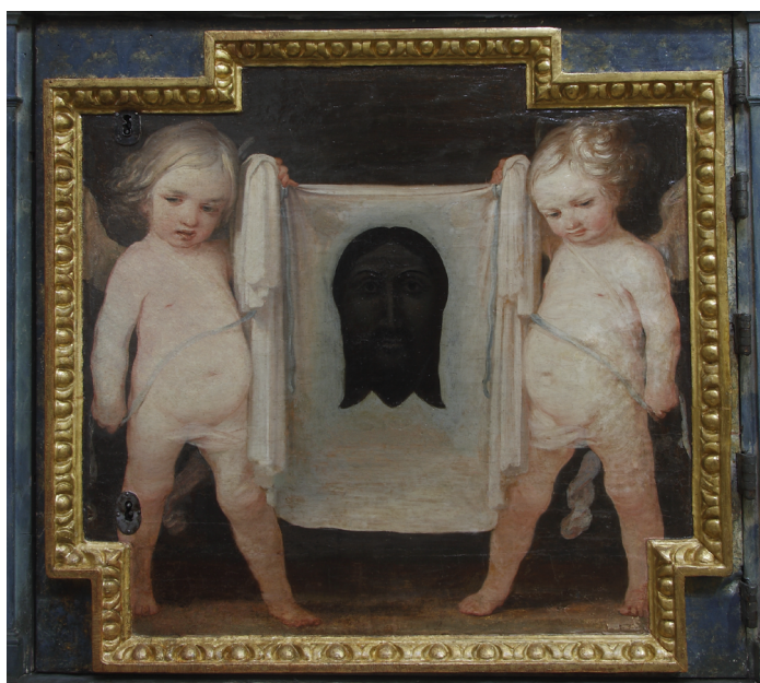
Fig. 2. Santo Rostro sostenido por ángeles, Sebastián Martínez Domedel, 1660. Jaén, Catedral de la Asunción

Alonso de Mena (1587-1646), Sebastián Martínez (ca. 1615-1667) (fig. 2) y Pedro Roldán (1624-1699) en la propia catedral de Jaén.