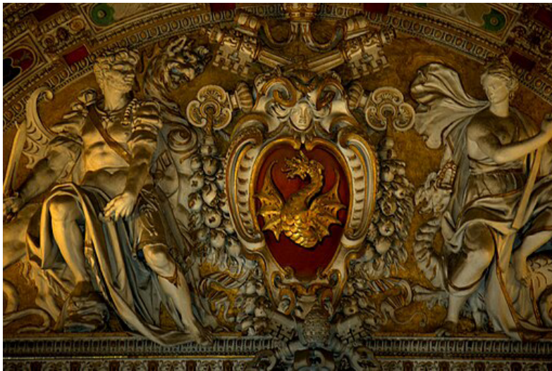
Figure 4. Boncompagni coat of Arms, pendiment and part of ceiling in the gallery of Geographical Maps. Apostolic Palace, Vatican City. Available through Creative Commons

Pius V (1566-1572). An ivory cross had the arms of Cardinal Carlo Borromeo (1538-1584), present in Rome with several curial roles from 1560 to 1564 while a cup or goblet made of rhinoceros horn bore the arms of Cardinal Francisco Pacheco de Toledo (1521-1579), ambassador of Philip II to the Holy See, cardinal protector of Spain, member of the Congregation of the Holy Office and Chamberlain of the College of cardinals, who lived in Rome from 1545 to 1574.