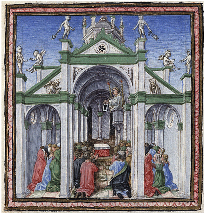
Fig. 5. Ostensión de la Verónica en San Pedro , « Fasti christianae religionis », Ludovico Lazzarelli (1490-1500), f. 41r. New Haven, Beinecke Rare Book and Manuscript Library, Ms. 391, Yale University Library

la miniatura que ilustra los Fasti christianae religionis de Ludovico Lazzarelli (1490-1500), en la que se muestra el interior de San Pedro en el momento de la mostración de la Verónica ( fig. 5 ), que aparece sostenida por un religioso acompañado de dos velas encendidas y sobre un púlpito. Esta fórmula de representación continuó en las ilustraciones de los Mirabilia Urbis , aunque más bien desde un balcón sobre un altar, quizás integrado en el ciborio ya estudiado. En este sentido, no podemos olvidar que la Verónica romana se guardaba en alto y eran exclusivamente los canónigos de la basílica quienes podían subir a su altar y tocarla, por lo que la mostración en la vieja capilla mayor de Suárez y en los púlpitos estaría en plena sintonía con la romana. Además, lo que pudo ser una práctica enraizada en el viejo templo catedralicio de Jaén tuvo su continuidad en el nuevo, pues se mantuvo la costumbre de mostrar la Verónica en los púlpitos del altar mayor.