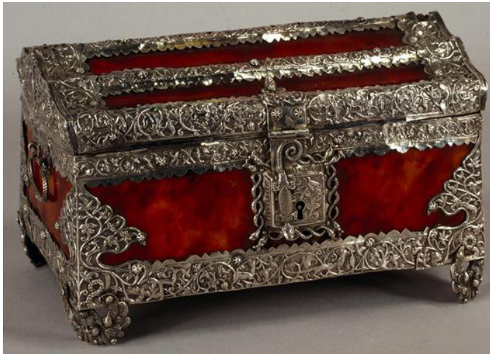
Figure 9. Indian Chest. Museu Nacional de Machado de Castro, Coimbra. Inventory number 04169 TC