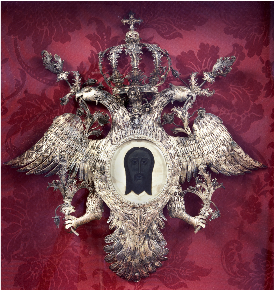
Fig. 6. Verónica, taller giennense, ca. 1740. Jaén, colección particular

Las primitivas, aquellas realizadas sobre piel, mostraban a la mujer Verónica sosteniendo el sudario con las manos, precisamente, tal y como aparecía en las primeras estampas difundidas por la imprenta. De este modo, se seguía el modelo romano y, ciertamente, no había una copia fiel de la reliquia giennense, más bien un retrato genérico de Cristo que también se mostraría aislado. Está bien documentado su encargo en Córdoba y también su ejecución en Jaén. 55 A lo largo del siglo XVI comienzan a extenderse las que sí reproducían