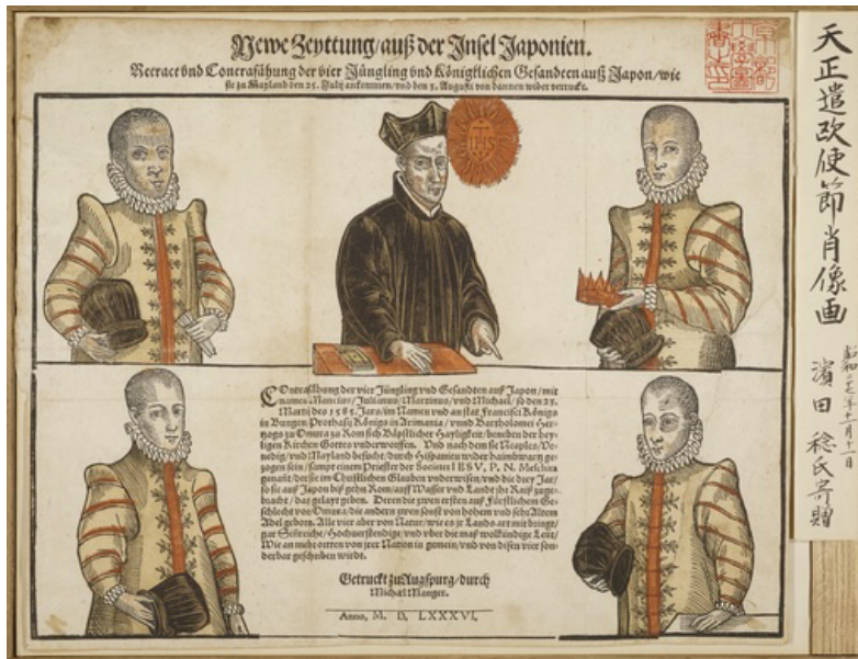
Figure 3. German broadside Neue Zeytung auss der Insel .

strong impression of the mission by the newly minted Japanese Christian youths left in European Christendom is borne out by a German broadside dated 1586, after they had left the continent ( figure 3 ).