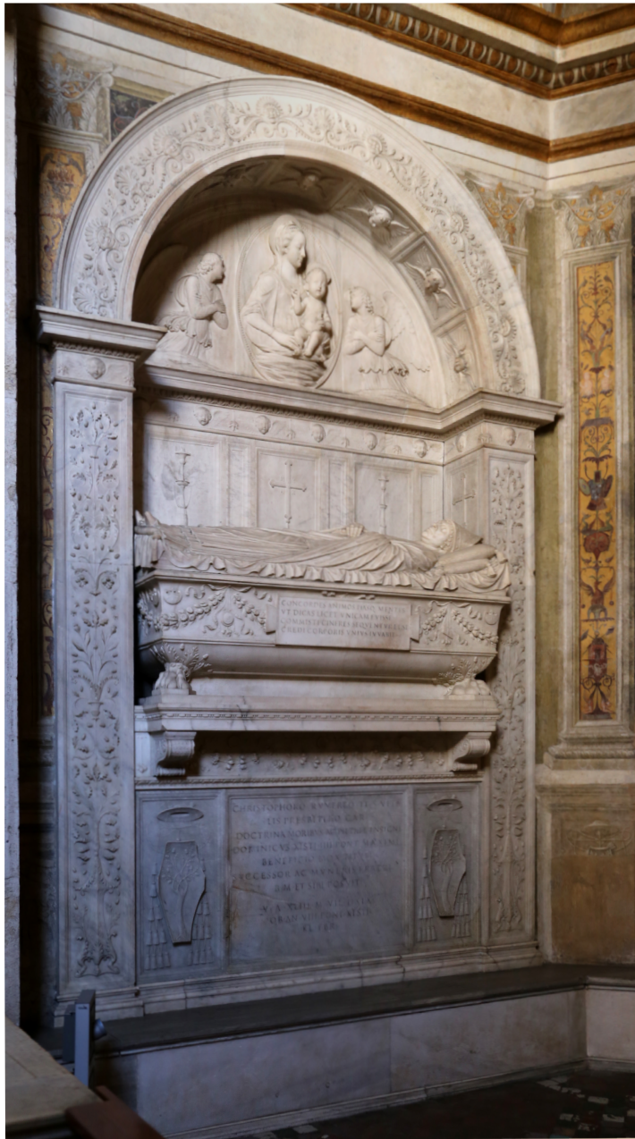
Fig. 6. Andrea Bregno, Tumba de Cristoforo della Rovere , siglo XV. Iglesia de Santa María del Popolo, Roma (Monumento funerario de Cristoforo della Rovere, por Saikko bajo licencia CC-BY-3.0)