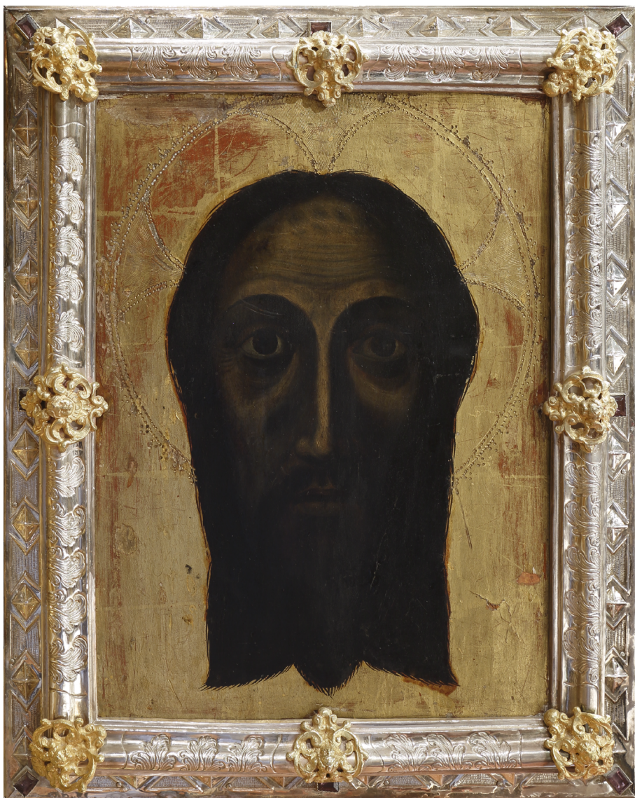
Fig. 7. Verónica , anónimo giennense, ca. 1584. Sevilla, Catedral de Santa María de la Sede y la Asunción