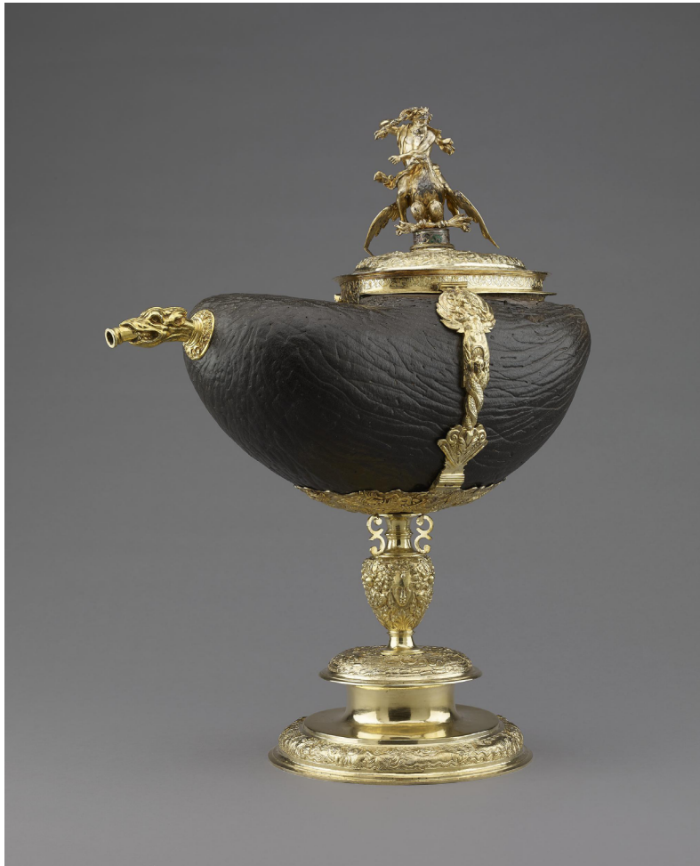
Figure 8. Seychelles nut ewer. British Museum, London