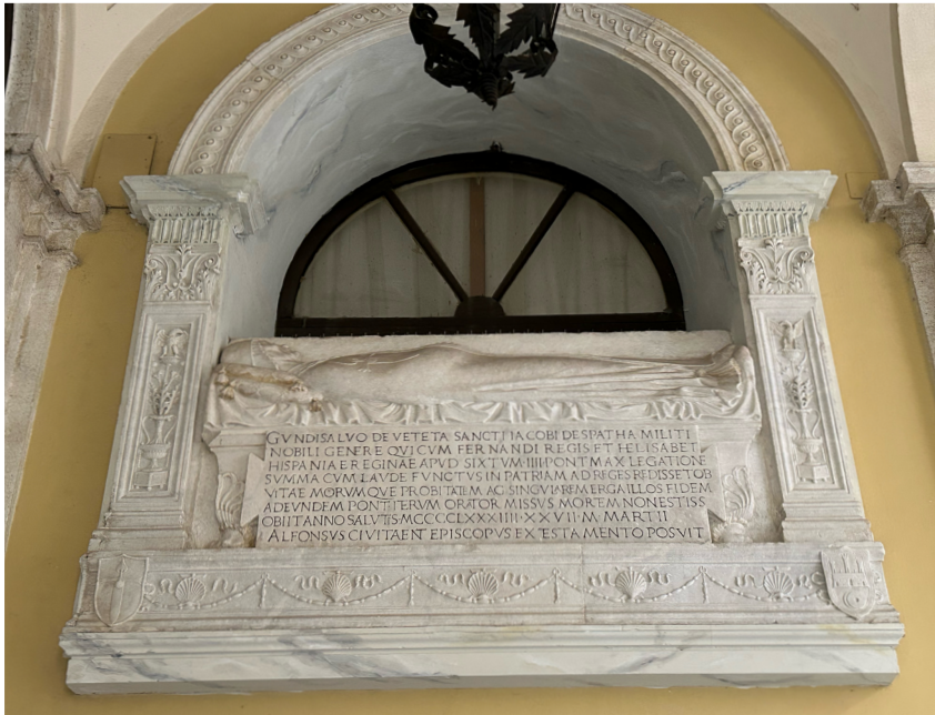
Fig. 2. Tumba de Gonzalo de Beteta, (detalle), 1484. Iglesia de Santa María de Montserrat de los Españoles, Roma.

Se trata de un sepulcro de tipo parietal que sigue muy de cerca el modelo de tumba mural renacentista. Recupera, como ya venía siendo frecuente en monumentos funerarios italianos del Quattrocento , la tumba en arcosolio, inspirada a su vez en la tradición arquitectónica del mundo clásico romano y de la tardoantigüedad. Este tipo de sepultura, caracterizado por su integración en el muro y la disposición de un arco de medio punto sobre el espacio funerario, evocaba un legado clásico y cristiano a la vez, lo cual le otorgaba una connotación simbólica de permanencia, dignidad y trascendencia.