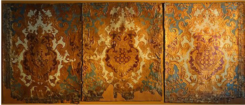
Figure 5. Guadamecil. Museu Nacional de Machado de Castro, Coimbra, Portugal. Available through Creative Commons