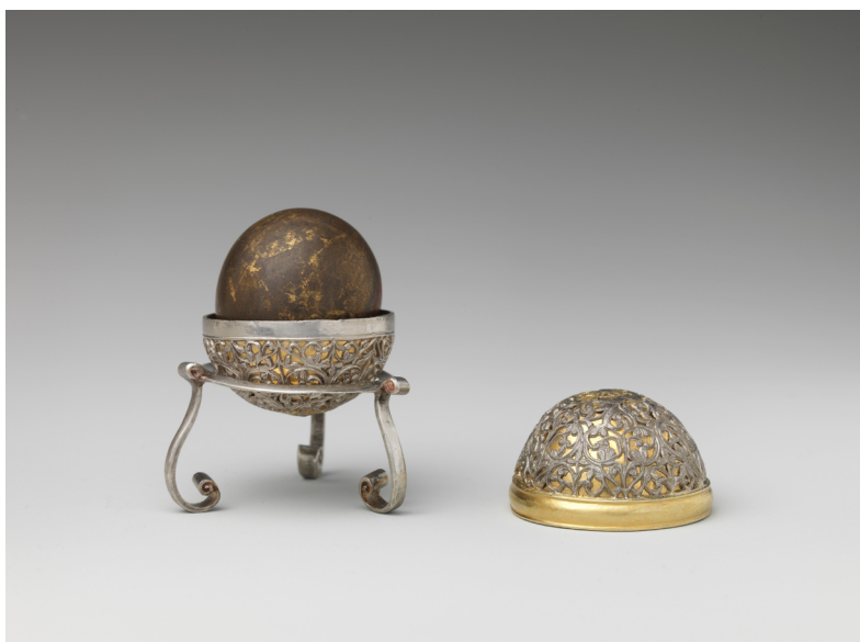
Figure 7. Bezoar Stone with Case and Stand. Metropolitan Museum of Art, New York. Object number 1980.228.1, .2a, b, .3

medical lore since Antiquity. 17 Though in general purportedly of Asian origin by the end of second half of the sixteenth-century there was steady flow of such stones from Peru to Europe. 18 This item, present in important collections, was often mounted, such as the seventeenth century exemplar at the Metropolitan Museum of Art ( figure 7 ), becoming an object of display, as in the case of one of them which were in the Apostolic Palace at the time of Gregory XIII: un vasetto d'argento tondo con una pietra di bezoar dentro . 19